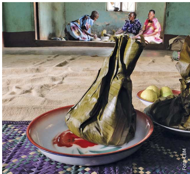
↑ Traditionelle Delikatesse in Uganda: Luwombo – im Bananblatt gedünstetes Hühner- oder Rindfleisch.

Fleisch zartkochen, Brühe aufbewahren. Öl in einer Pfanne erhitzen, die Zwiebel darin goldbraun anbraten. Fleisch dazugeben, anbraten (falls nicht vorgekocht, gut durchbraten), salzen. Knoblauch, Pilau Masala, Zucker und Tomatenmark hinzufügen, zwei Minuten umrühren.