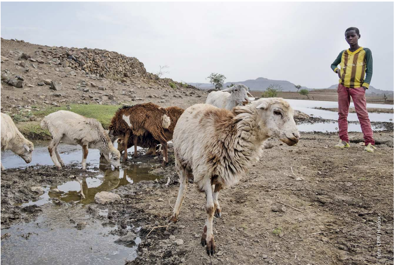
↑ Dürre in Äthiopien: Schafe finden Wasser an einem Damm, der vom CBM-Projektpartner ORDA repariert wurde.

aufgrund ihrer Arbeit die geltenden jüdischen Reinheitsvorschriften nicht einhalten können, sind sie oftmals von Synagogengottesdienst und Tempelbesuch ausgeschlossen. Durch die Verkündigung der Frohen Botschaft an die Hirten und die Einladung, das Neugeborene zu besuchen, werden die Hirten gewürdigt und in die Gemeinschaft Gottes eingeladen.