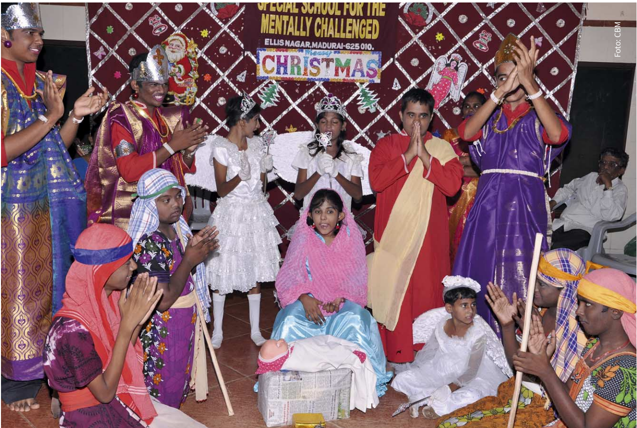
↑ Weihnachtsfeier in einem CBM-geförderten Projekt in Indien.