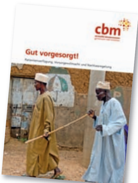
■ Unsere Vorsorgebroschüre bietet weitere Tipps zum Thema Vorsorge.