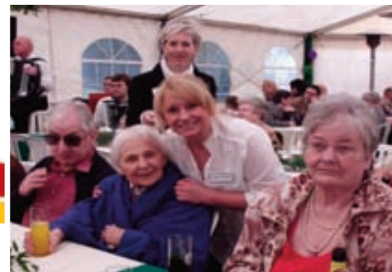
■ Trotz Regen gute Stimmung im Festzelt.