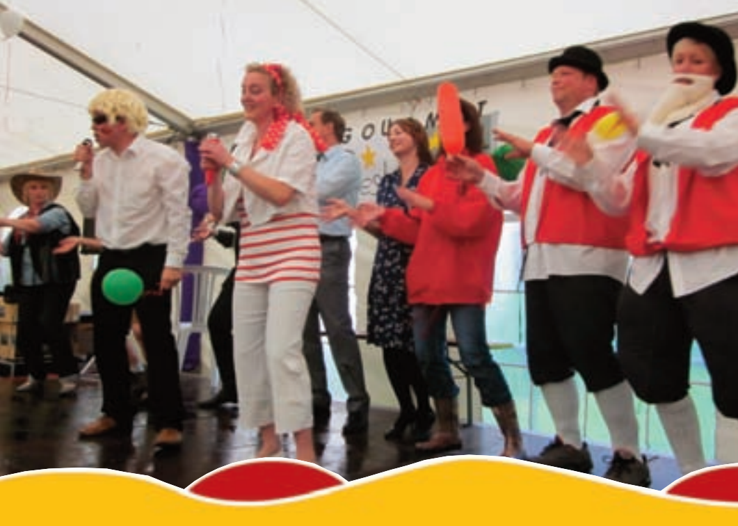
■ Die Playback-Show der Mitarbeiter kam bei den Gästen richtig gut an.